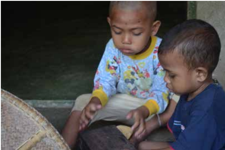
Rajah 2 Kanak-kanak orang Jahut melihat alatan tradisional pertanian.

Setelah beberapa tahun menuntut ilmu, lelaki itu berkahwin dengan anak batin berkenaan. Hasil perkahwinannya, dia dianugerahkan seorang anak lelaki. Lelaki berkenaan meminta izin bapa mentuanya untuk mengadakan majlis bersunat kerana dalam kaumnya anak lelaki diwajibkan bersunat. Pada permulaan bapa mentuanya