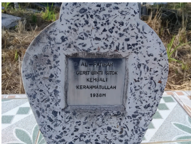
Rajah 5 Batu nisan yang menunjukkan terdapat suku Penan yang memeluk agama Islam sebelum tahun 1930an. Penemuan ini mungkin lebih awal daripada yang dilaporkan oleh Needham.

komuniti Penan Muslim dan Penan asli. Jika dipandang sekilas lalu, kampung yang bersambungan ini sukar dipastikan jenis keagamaan penduduknya kerana hanya gereja yang dibina di kampung ini dan surau pula terletak di seberang jalan, periferi komuniti Penan Muslim.