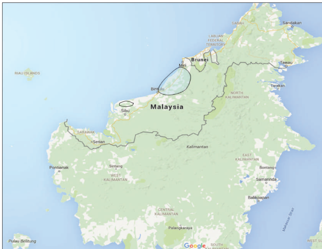
Rajah 2 Peta lokasi penelitian.