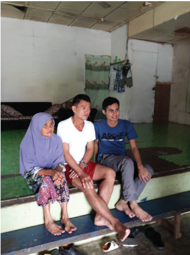
Rajah 3 Informan di Kampung Penan Muslim.

Di Sarawak, terdapat dua bahasa lingua franca utama, iaitu dialek Melayu dan bahasa Iban (lihat Azlan Mis, 2010). Dua bahasa yang berstatus lingua franca ini seharusnya memainkan peranan tertentu dalam isu pertukaran bahasa baharu suku Penan. Akan tetapi kenyataannya adalah sebaliknya kerana mereka memilih bahasa Bintulu. Faktor bahasa Iban tidak dipilih mungkin kerana tidak sejajar dengan agama mereka, walaupun kajian lapangan ini mendapati rata-rata orang Penan dewasa fasih berbahasa Iban. Dalam erti kata lain, bahasa Iban ialah bahasa ibunda suku Iban, yakni suku bukan beragama Islam dan pada ketika itu, banyak yang masih animisme. Tidak ada alasan untuk mereka menukar bahasa bukan Islam lain kerana bahasa Penan sendiri ialah “bahasa bukan Muslim”. Dialek Melayu pula walaupun “bahasa